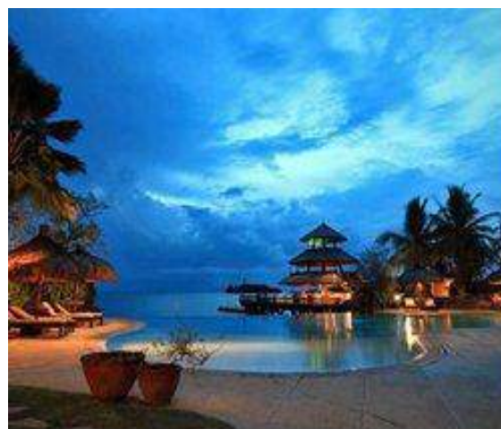
パールファーム・ビーチリゾート（サマル島）