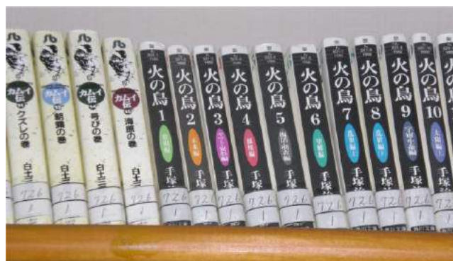
蔵書の中には懐かしいアニメシリーズも!