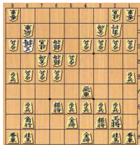
米長永世棋聖がコンピューターに敗北した将棋

“いつまでも心に若い愛人を”。家では口にしにくい格言も、若さを保つ秘訣になるのではないだろうか。(読売新聞より抜粋)