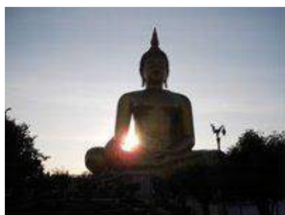
アントンの坐大仏