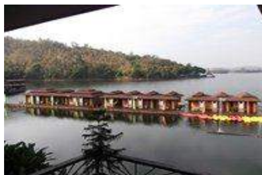
湖上に浮かぶラジャブリーリゾートホテル