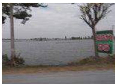
水害で溜め池化した田んぼ