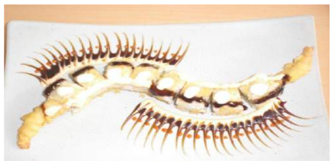
すもう巻き ：えびの天ぷらを寿司飯で巻いてあり、ポリウレムたっぷり (169 パーツ)