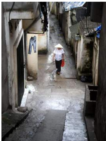
田中 裕会員 『ハノイ』