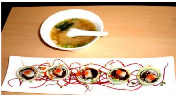
サマーロール ：きゅうり・貝柱刺身・クリームチーズ・ピーツ・アボカド・とびこ等の材料使用

ニマンヘミン通りのソイ13をセントラルデパート方向へ100メートルほど入った四つ角左斜めに、相撲力士の丸看板「相撲スシ」が見える。