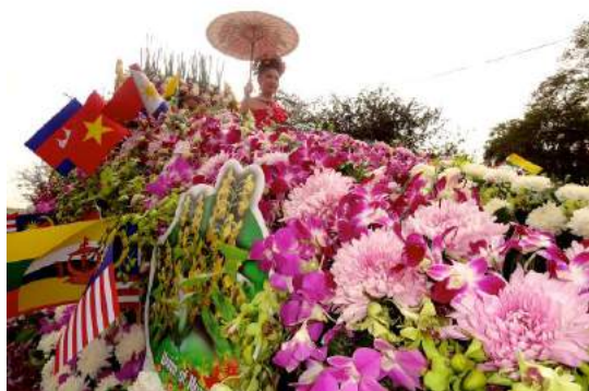
高嶋 恭子会員 『フラワーフェスティバル』