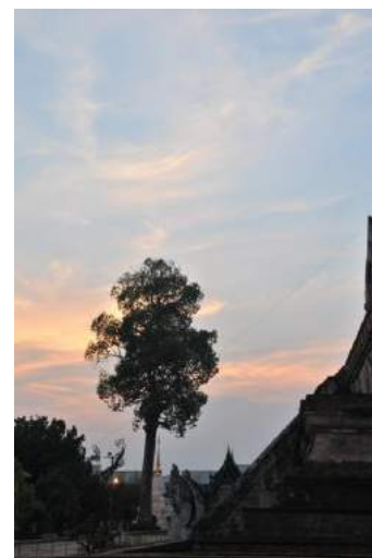
山口 素盟会員 『夕暮れのワットチェディラン』