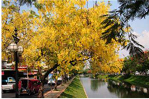
『ゴールデンシャワー』