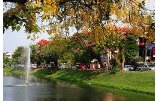
『ゴールデンと火炎樹』