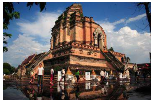
『雨後のチェディルアン』