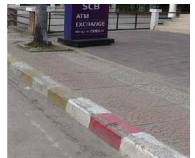
奥の黄白は1分間駐車可 手前の赤白は駐車禁止