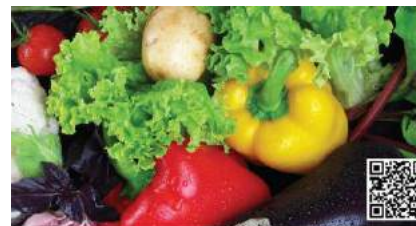
月例イベント「リンピンスタディ」第1回

現在、自社農業を運営しながらバンコクのフジスーパー、サイヤムパラゴンなどに日本の無農薬有機野菜を供給している。リンピンスーパーメイヤー店の「My Food Service」コーナーはチェンマイ初の拠点で人気上昇中。