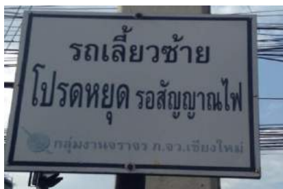
青信号になるまで左折出来ません