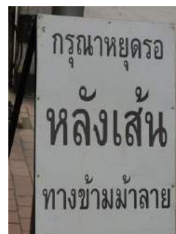
横断歩道の手前で一時停止