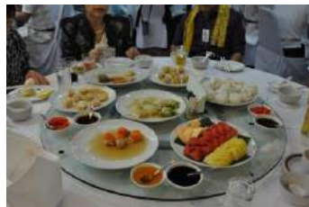
豪華な中華料理 タレはどれ付ける 蜂蜜？