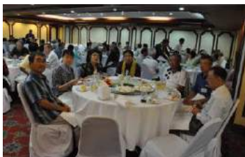
会場風景 出席者86名 そのメガネの人 どれだけ飲むの