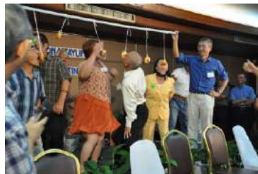
パン食い競争 青い服を着た人 そんなにゆらしちゃダメ！