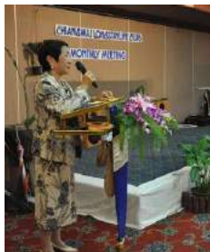
クイズ タイは幾つの国と接しているか？