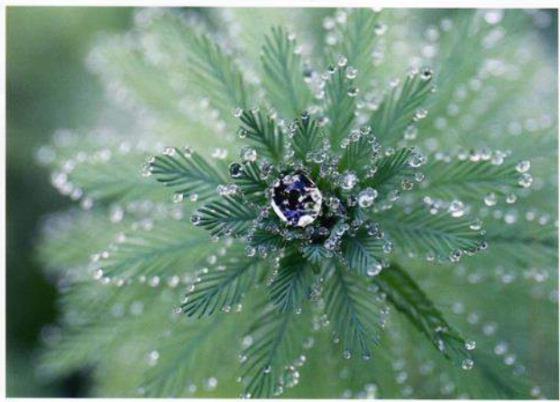
一位「何カラット？」 奥村 辰郎会員