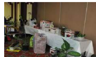
オークション提供品完売 ありがとうございました