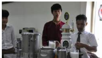
飲み物おかわり自由 ビールが無くなりそう