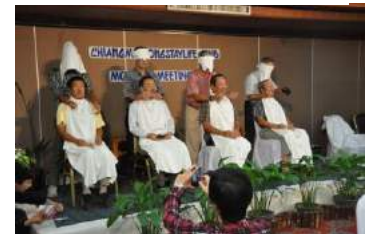
二人羽織 イヤーンバカーン もっと下