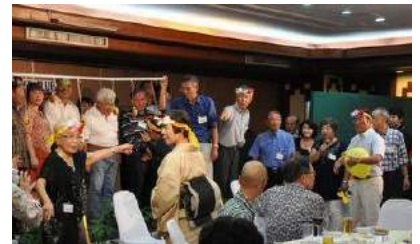
和服の応援団長 はちまき姿が素敵