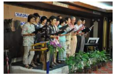
コーラス同好会 アンコール