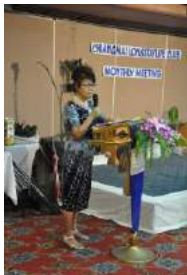
寿ちゃん もっと高く

コーラス、クイズ、二人羽織、パン食い競争、借り物競争、ペアが協力して風船割り、オークションと楽しく盛大な忘年会となりました。出演者、実行委員の皆様ありがとうございました。