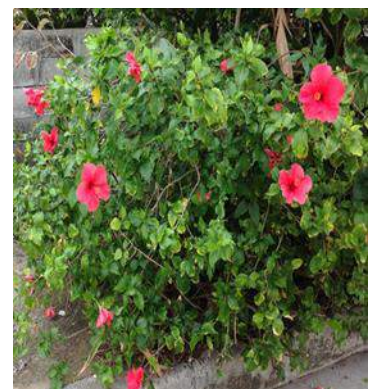
1 年中絶え間なく様々な色のハイビスカスが咲き続ける沖縄。