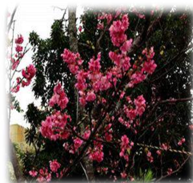
1 月は沖縄の桜祭り。海開になった近所の沖縄の桜(寒緋桜)。