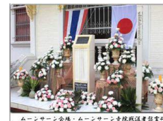
ムーンサーン会場、ムーンサーン寺院戦没者慰霊碑