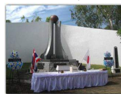
バンガート会場、バンガート戦没者追悼の碑

1944年（昭和19年）、日本軍はビルマ国境を越え、当時イギリス領だったインド北東部の都市・インパールへ向けて進軍。しかし、食糧や弾薬の補給が続き作戦は開始後三ヶ月で中止。その撤退路は敵から追われる以上に、険しい山道、風土病、飢餓が行く手を阻み、生き延びられた将兵の一部はビルマと国境を接するメーホンソーンを通過してチェンマイで終戦を迎えました。インパール作戦による死傷者は約7万人、またはそれ以上とも言われています。