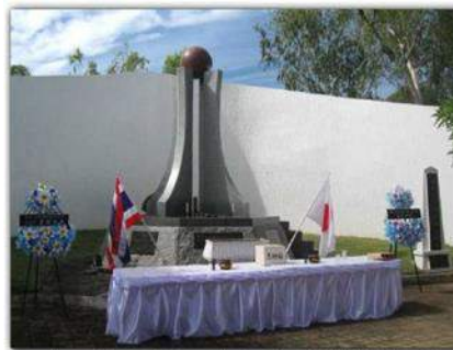
バンガード会場・バンガード戦没者追悼の碑