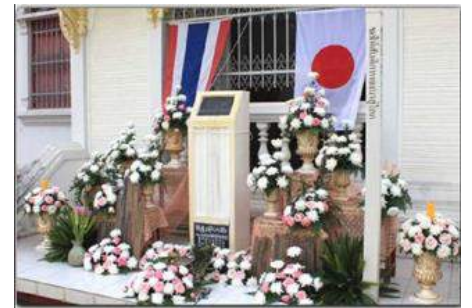
ムーンサーン会場・ムーンサーン寺院戦没者慰霊碑