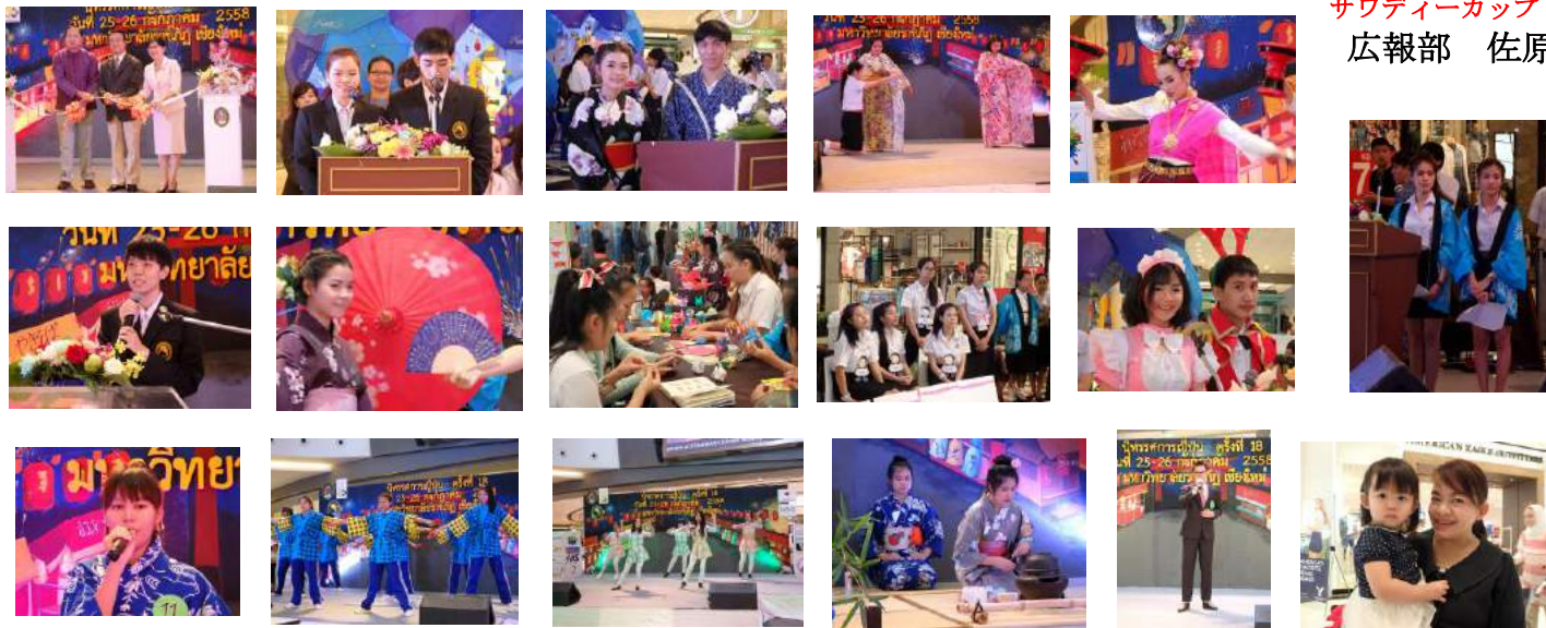
サワディーカップ 広報部 佐原

《日本祭》は2015年7月24日（金）～26日（日）にラチャパット大学と、メーヤーライフショッピングセンター 1Fで開催された。日本の文化を紹介してくれるラチャパット大学等の学生さん達の事前練習のためにCLL会員とチェンマイ茶道同好会が7月6日（月）～7月22日（水）の練習担当日に、同校を訪問した。《日本祭》当日は、大勢の人で各々のコーナーは溢れ返りラッシュアワーの様、それでも学生さん達は練習の成果を見事に披露してくれました。この様な催しを通じて日タイ親善のお役に立てたのならばこんなに嬉しいことはない。