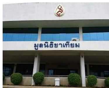
タイ義肢財団のビル

今後も収集があり次第、ストックキングと合わせて寄付していきたいと思っておりますので、引き続き皆様のご協力をお願い致します。