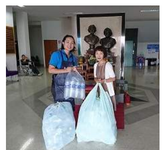
國吉様にお授けしました