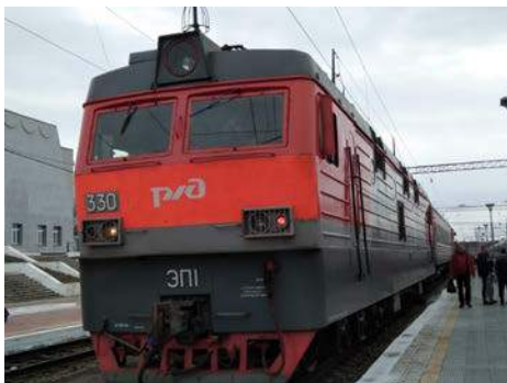
シベリア鉄道の列車